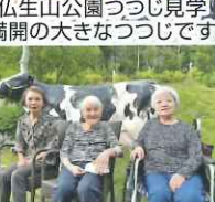
等身大の牛の置き物と一緒に 笑顔満開