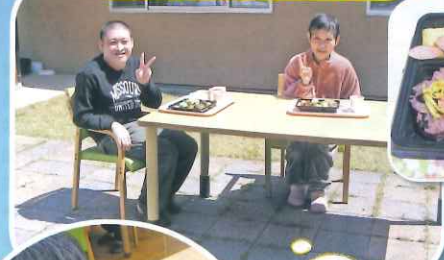
開所記念&お花見弁当