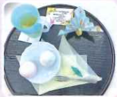
折り鶴付き紅白饅頭