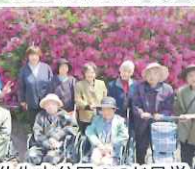
仏生山公園つつじ見学 満開の大きなつつじです