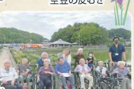
鶴籠公園菖蒲見学