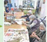
つくしの袴取り懐かしいな〜