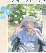
勝名寺へ紫陽花見学 笑顔がはじけます