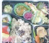
開所記念お祝い弁当