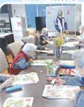
脳トレで間違い探しを しています