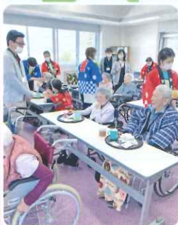
職員もハッピーを着て歌でお祝いを盛り上げました