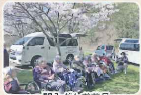
門入ダムお花見 穴場スポットです