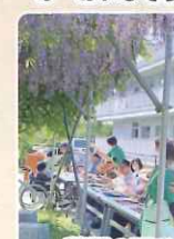
藤棚の下で ティーパーティー