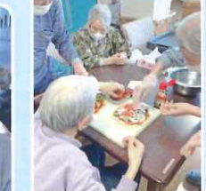
初めてのピザ作りに挑戦 生地から作りました