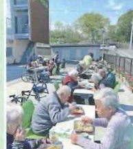
外の花見弁当最高!!