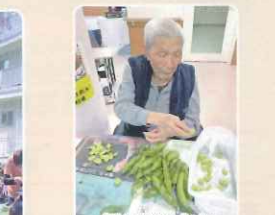
緑が鮮やかな 空豆の皮むき