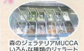
森のジェラテリアMUCCA いろんな種類のジェラート