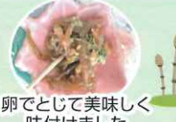
卵でとじて美味しく 味付けました