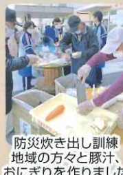
防災炊き出し訓練 地域の方々と豚汁、おにぎりを作りました

今年三羽のつばめが無事巣立ちました。バラのアーチを通して親つばめは一生懸命に餌を運んでいました。