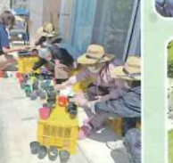
ゴーヤの種まき 頑張ってます