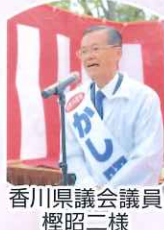
香川県議会議員 櫻昭二様