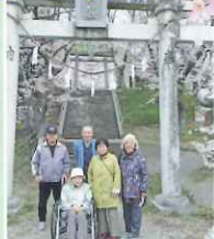
白山神社満開の桜