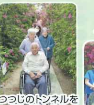
つつじのトンネルを 通り抜けます