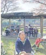
鳥のさえずりの中 久しぶりの外出