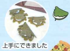
上手にできました