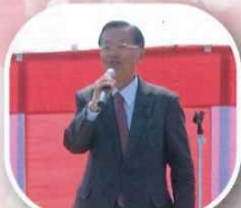
香川県議会議員 榎 昭二様