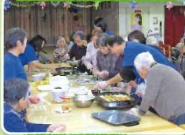
ホットプレート を使用して、ペ ビーカステラを 作りました。やは り女性のご利用 者の方は手際が いい!!アツアツ を頂きました。