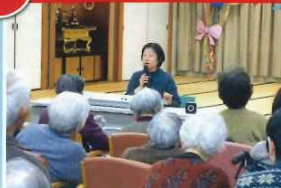
流れるような音色と歌が心に響きます。