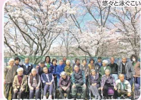
三木町総合運動公園(デイサービスのご利用者)