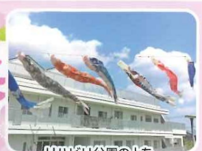
リハビリ公園の上を悠々と泳ぐこのほり