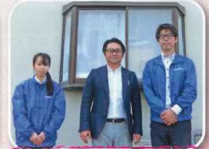
株式会社ユーリックホームのみなさん、ありがとうございました。