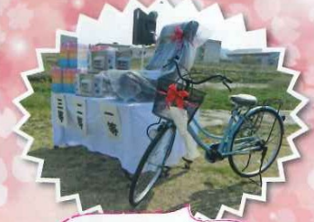
今回の豪華商品はこちらです!!