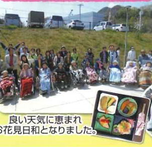
良い天気恵まれ お花見日和となりました。