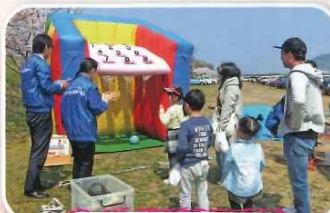
子供たちに大人気だったボールシュー