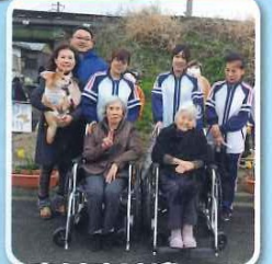
寒さを吹きとばし、 元気に参加されました。