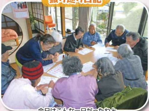
今日はこんな一日だったねと 習慣になってます。