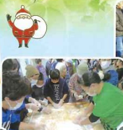
つきたてのお餅をちぎって丸めるよ!