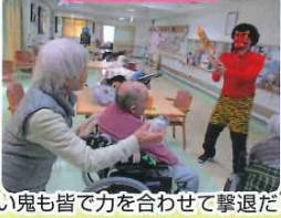
怖い鬼も皆で力を合わせて撃退だ!!