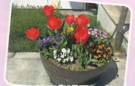
リハビリ公園のチューリップとパンジーの寄せ植え