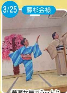
華麗な舞でうっとり