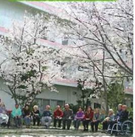
さんがわの庭の桜も咲き誇り、 皆さんでお花見をされました。 心地良い風もあり、良い気分転換 になりました。