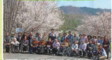
晴天の中でのお花見でした。桜も見頃で、 暖かい日差しの中、思いきり自然を満喫 されました。