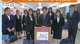
看護：医学的管理の現状を熱心に 学ばれていました。