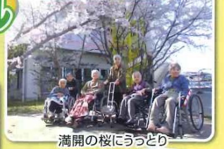
満開の桜にうっとり