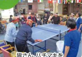
皆さん、ハチマキを きりりと巻かれ気合いが入っています。 笑顔いっぱいプレイ されました。