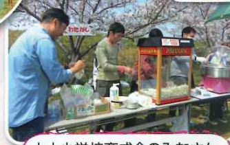
木太小学校育成会のみなさん