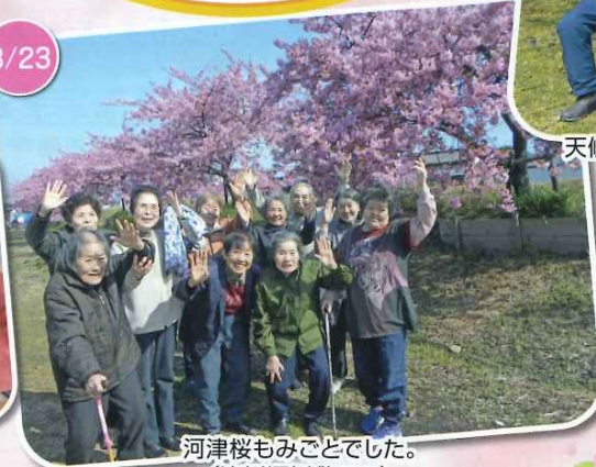
河津桜もみごとでした。 (湊川河川敷にて)