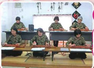
すずらん会様 大正琴演奏