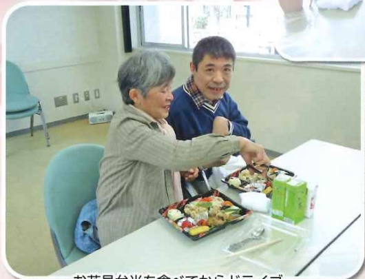
お花見弁当を食べてからドライブ