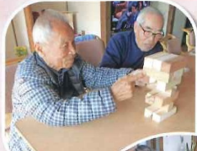
手作りジェンガで 楽しんでます。