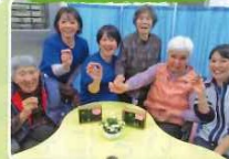
どんぐりや折り紙な どを使い、題して「ト トロの森」の置き物 を作りました。作業 する姿も笑顔いっ ぱいでした。