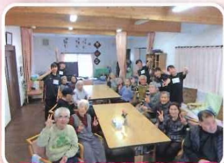
玉藻中学校のみなさんがボランティアに来て下さいました。若いエネルギーでみんな元気ハツツ!!