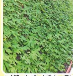
よく繁ったゴーヤのカーテン