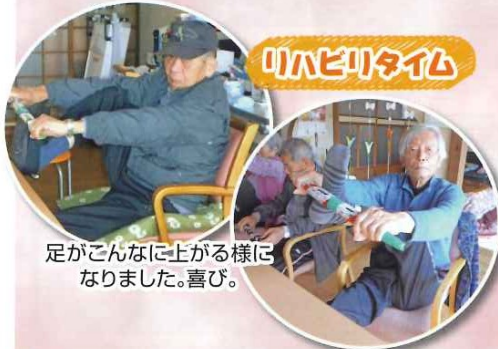
足がこんなに上がる様は なりました。喜び。