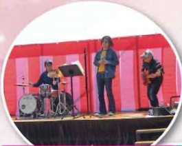
こみいまブルースバンド様