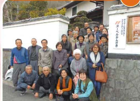
美味しいお弁当を食べた後、カラオケや折り紙など 楽しい時間を過ごされました。ご利用ありがとうございました。