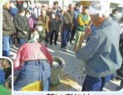
若い者には負けないぞ!