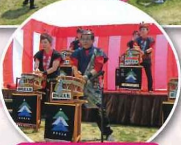
讀修流太鼓保存会様