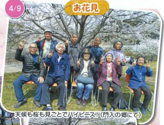
天候も桜も見ごとでハイビス!(門入の郷にて)