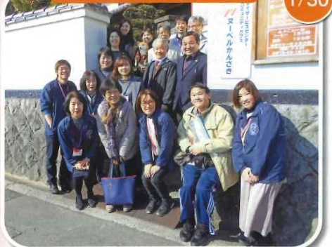
施設やデイサービス活動を見学されました。