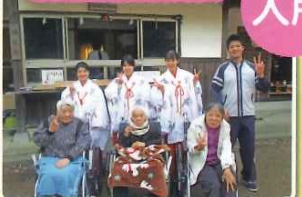
きれいな巫女さんたちとハイチーズ!!