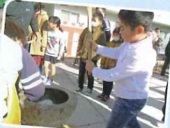
ほくもチャレンジ!