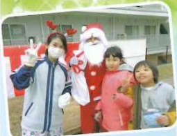
サンタさんとハイポーズ!

香川おもいやりネットワーク居場所づくりの一環として、三世代交流のもちつき大会を三木町社会福祉協議会の後援をいただき開催しました。地域の子ども達が気軽に過ごせる場の提供と高齢者と共に過ごす学びの機会の提供、また地域の方々も参加し世代間交流を図ることも、役割や生きがいづくりの場の提供を目的として行いました。石臼を使って白餅、餡餅、エビ餅、豆餅、のり餅、5種類の餅をつきました。豚汁の炊き出しも喜ばれました。また、サンタさんからのプレゼントに子供達も大喜びでした。今後地域に根差した施設になるよう努力していきたいと思っております。