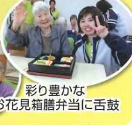
彩り豊かな お花見箱膳弁当に舌鼓