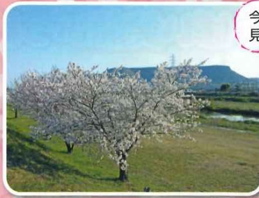
今年も春日川河川敷の桜が見事に満開になりました。