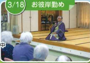
厳かな雰囲気の中 皆さんお参りを されていました。