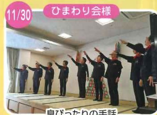
息びつたりの手話