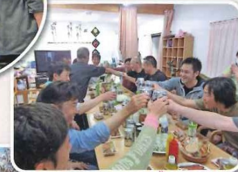
ご協力ありがとうございました。