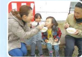
あ〜ん豚汁おいしい!