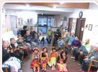
木太小学校の子ども達がフラダンスの慰問に来て下さいました。本格的なフラダンスに大感動☆