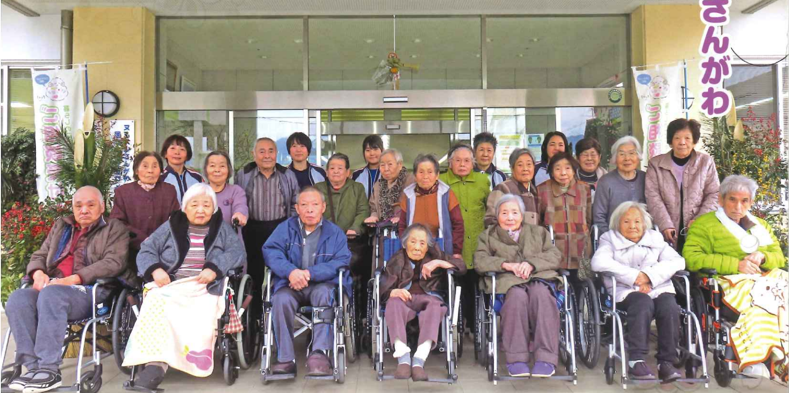
(撮影時のみマスクを外しています)