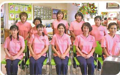
全員集合 心新たに頑張ります

ショートステイご利用者様のうち、百歳以上の方が5名も元気に過ごされています。ヌーベル三木の宝です。今後とも益々お元気で長寿の記録を伸ばしていただきたいと思っております。