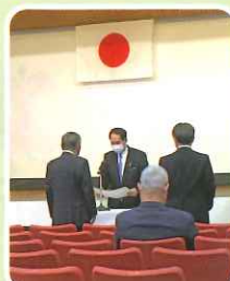
浜田知事より賞状授与