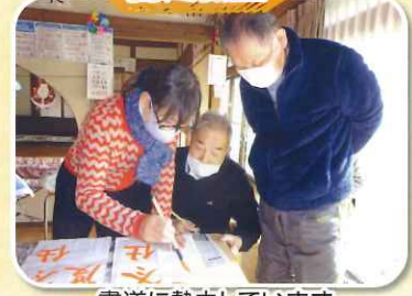
書道に熱中しています