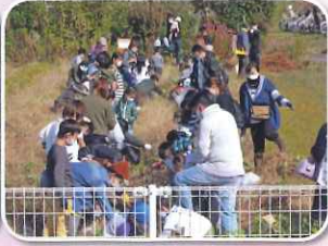
木太地区有志の皆さまの笑顔も光ります!