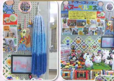
今年の干支、丑年のマスコットをたくさん作りました

木太コミュニティセンターにて、ご利用者の皆さまと協力して作り上げた作品を展示することができました。