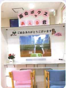
面会ボックス「あえる君」