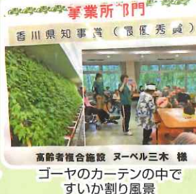
高齢者福祉施設 ヌーベル三木 織 ゴーヤのカーテンの中で すいか割り風景