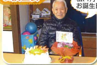
私、1月11日が お誕生日です