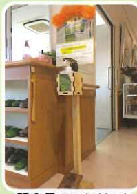
記念品でいただいた 「県産ヒノキのアルコール 消毒液スタンド」