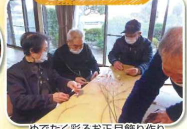
めでたく彩るお正月飾り作り