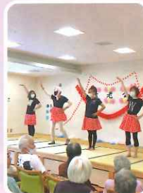
歌と踊りで敬老会を 盛り上げます