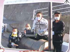
煙がもくもくしてる中 おいしい焼き芋が 焼けています