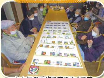
大人気の手作りすごろくです