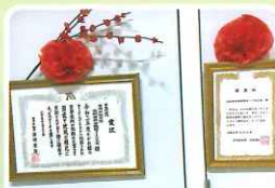
殿堂入り認定の賞状も いただきました