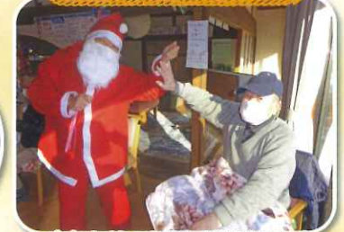
今年もサンタさんが来ましたよ