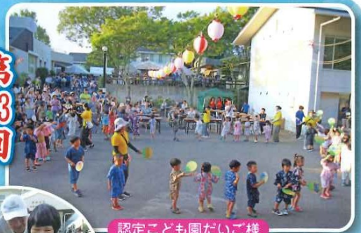
認定こども園だいご様