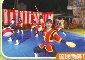
琉球国祭り太鼓エイサー様