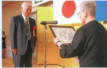
ボランティア協力団体表彰