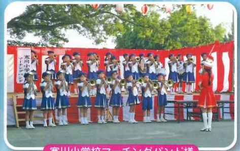
寒川小学校マーチングバンド様