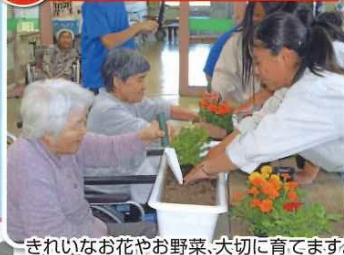
きれいなお花やお野菜、大切に育てます。