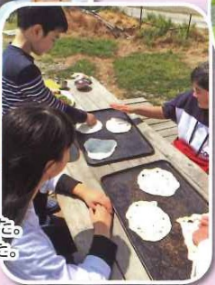
大山牧場へ遠足に行きました。 手づくりピザを体験しました。 出来たてで美味しい!!