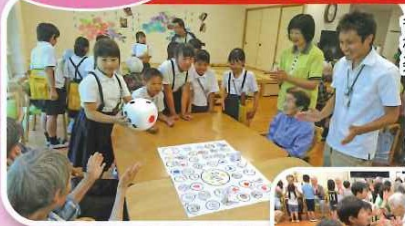
各班に分かれての様々なゲームを楽しみました。