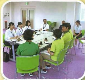
いろんな質問もされていました。