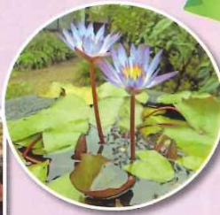
地域の方から いただいた水蓮が 咲きました!!