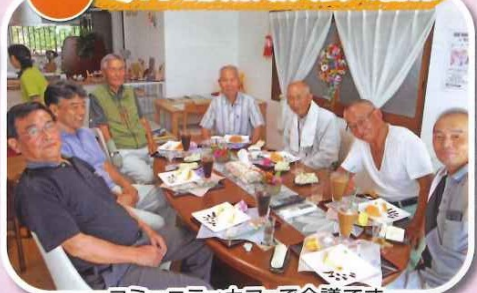
コミュニティカフェで会議です。