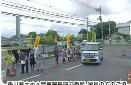
香川県さぬき警察署長尾交番所、署員の方のご協力を得て、ご利用の方とドライバーの方へ、安全運転の啓発に努めました。