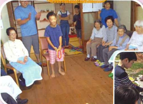
交流輪投げを楽しむわんぱく達!!