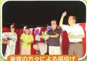
来賓の方々による福投げ