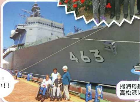
大きい!! カッコいい!!