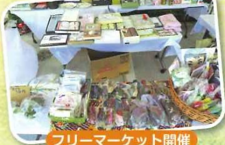
フリーマーケット開催