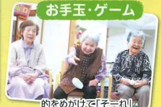
的をめがけて「そ=れ」