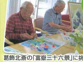
葛飾北斎の「富嶽三十六景」に挑戦!!