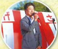
香川県議会議員 松原哲也様