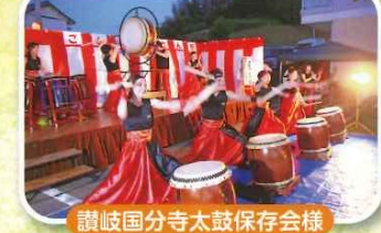
讃岐国分寺太鼓保存会様