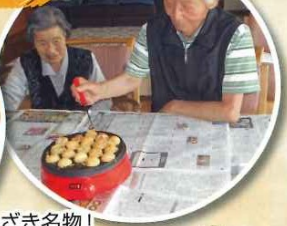
かんざき名物! お好み焼きにたこ焼き