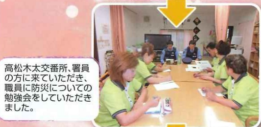
高松木太交番所、署員の方に来ていただき、職員に防災についての勉強会をしていただきました。