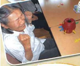
黒ひげ飛び出て びっくりー!!