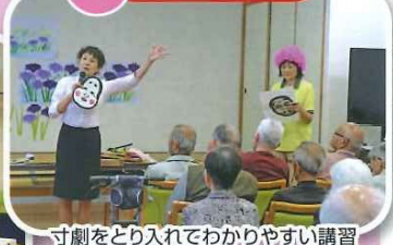
寸劇をとり入れてわかりやすい講習