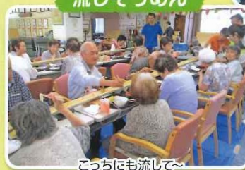
こうちにも流して~