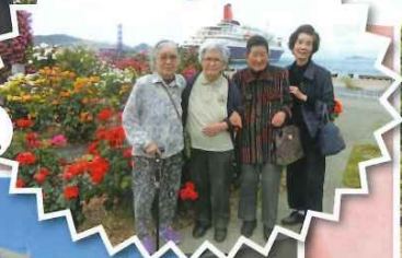
バラにも負けないステキな笑顔です。