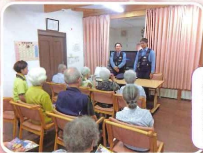
高松木太交番所、署員の方へ特殊サギについての講話をしていただきました。みなさん真剣な表情で聞かれました。「絶対にサギには合わないぞ!!」と強く思いました。