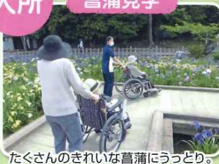
たくさんのきれいな菖蒲にうっとり。