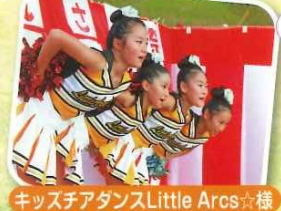
キッズアダンスLittle Arcs様