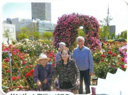
サンポート高松へバラを見に行きました。