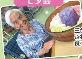
三色ソーメン、 これ一人では 食べれんわあ!