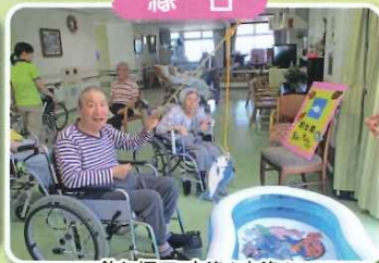
釣り堀で、大漁!大漁!