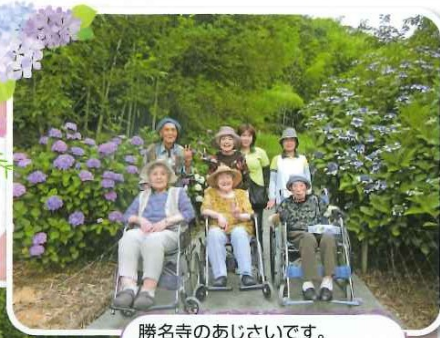
勝名寺のあじさいです。雨に濡れてとてもきれいでした。