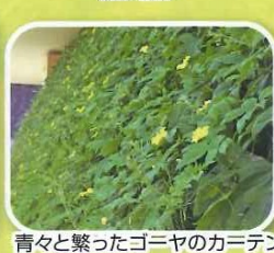
青々と繁ったゴーヤのカーテン