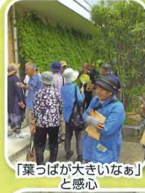
「葉っぱが大きいなあ」と感心

県庁のインターンシップに来られている学生3名が、福祉について学ぶために来園されました。施設の概要説明や見学の後、現場の職員から生の声を真剣に聞かれました。