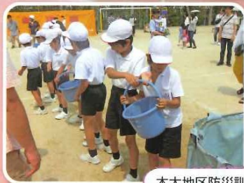
木太地区防災訓練に参加しました。