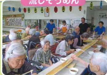
夏の“涼”を感じました。