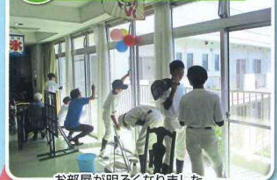
お部屋が明るくなりました。暑い中、ありがとうございました。