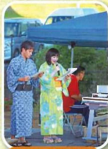
浴衣姿での司会者