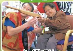
よく狙って!! 「ね・ら・い・う・ち!!」