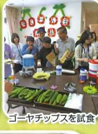
ゴーヤチップスを試食