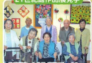
私達が作った作品。素敵でしょ??