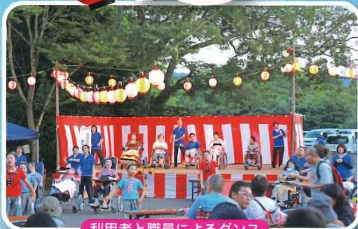
利用者と職員によるダンス

8月4日(日)第23回地域交流夏まつりを開催致しました。今年、さゝ連様の阿波踊りと地域の方々による催し物など、会場の皆様と一緒にぎやかに踊り楽しいひとときを過ごす事が出来ました。ボランティアの皆様をはじめ地域の皆様のご協力により無事終える事が出来ました事、心から感謝致します。ありがとうございました。