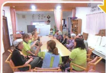
教えていただいたことをご利用者様にも伝え、知っていただけます。