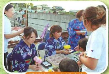
受付はみんな浴衣姿