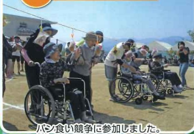
ハン食い競争に参加しました。楽しかったです。