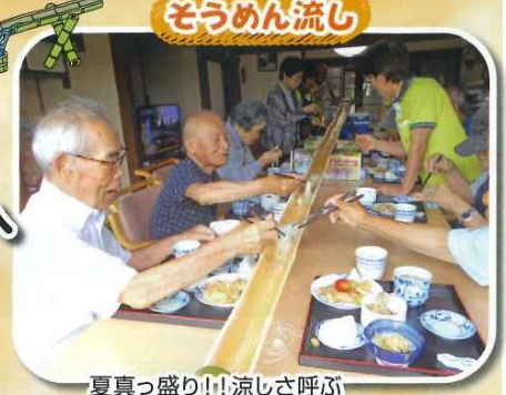
夏真っ盛り!! 涼しさ呼ぶ そうめん流し!!