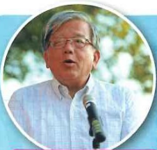
さぬき市長 大山茂樹様