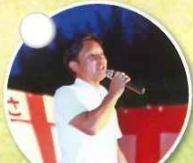
前衆議院議員 瀬戸隆一様