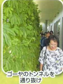
ゴーヤのトンネルを通り抜け