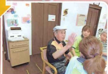
大地震の体験談を話して下さいました。