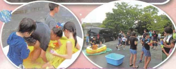
おもいやりネットワーク事業フードバンク香川よりいただいたうどんを食べた後、水鉄砲で楽しく遊びました。