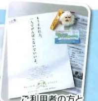
ご利用の方と作成したスドラップを配りました。

日頃からお世話になっているJA石田支店石田女性部様、JA石田支店神前女性部様、徳武産業様、香川県退職公務員連盟大川支部様と食事をしながら意見交換会を開きました。