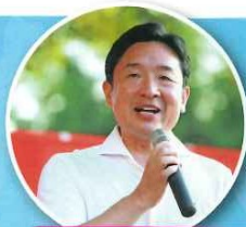
前衆議院議員 瀬戸隆一様